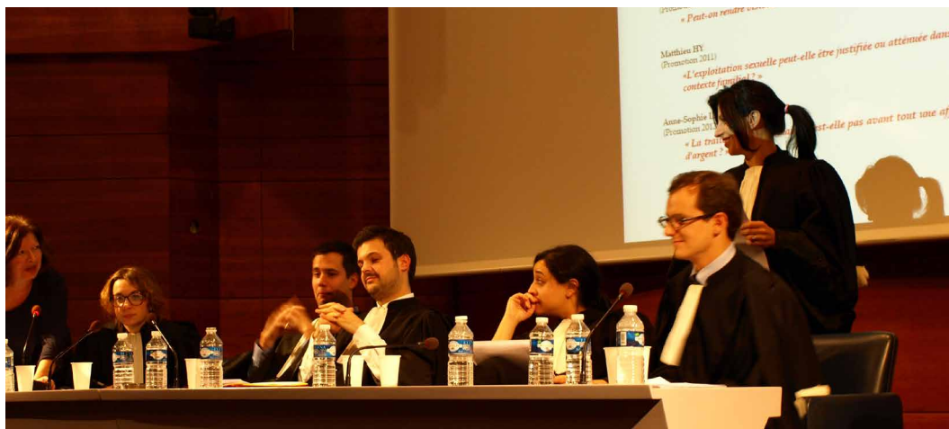
Les candidats avocats au concours de plaidoiries, 2 e édition des Prix Jeunes contre l'exploitation sexuelle, Maison du Barreau de Paris, 2014

ont participé au concours de plaidoiries depuis la 1 ère édition