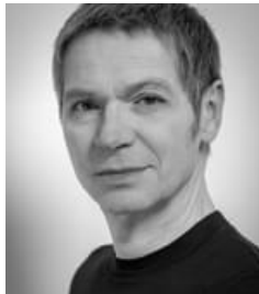
Gérard Sanz Photographe, webmestre & autorisations de tournages à la Direction de la Jeunesse et des Sports Mairie de Paris Photographe de portraits