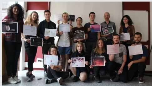
Elèves de l'ENS Louis Lumière - Concours de visuels 2018