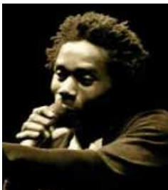
Black Kalagan Artiste slameur Parrain du concours des slams