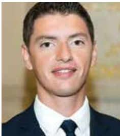
Mickaël Nogal Député de la 4ème circonscription de Haute- Garonne Vice-président de la Commission des affaires économiques Membre de la Délégation aux droits des femmes de l'Assemblée nationale