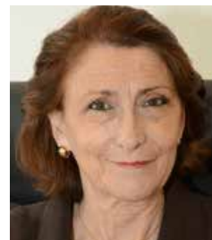
Anne Souvira Commissaire Divisionnaire chargée de mission aux questions relatives à la cybercriminalité - Cabinet du Préfet de police de Paris